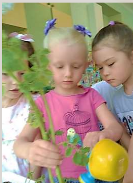
А потом полили....