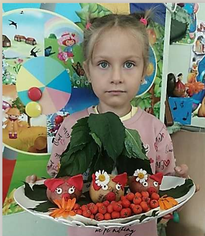
Подделки из картофеля