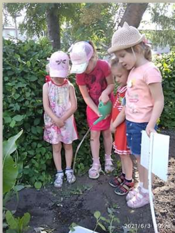
Снова посадили, полили...