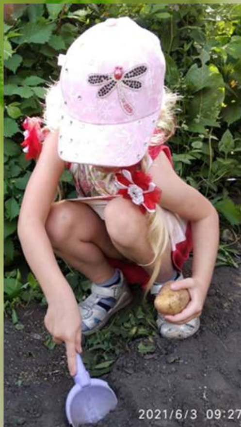
Посадка картофеля со второго горшка