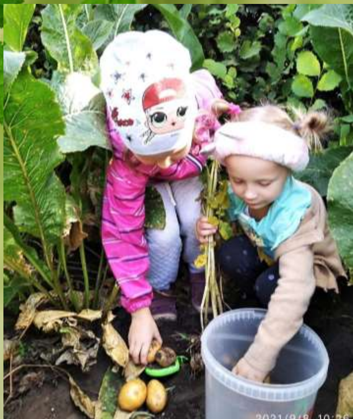
Вот осень наступила, пора собирать урожай