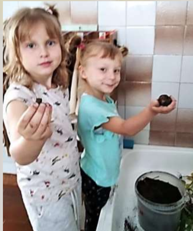
Посмотрите, вот такой картофель у нас вырос на подоконнике.