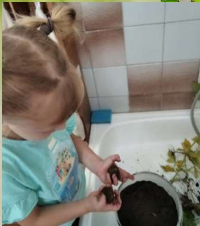
Наш первый урожай