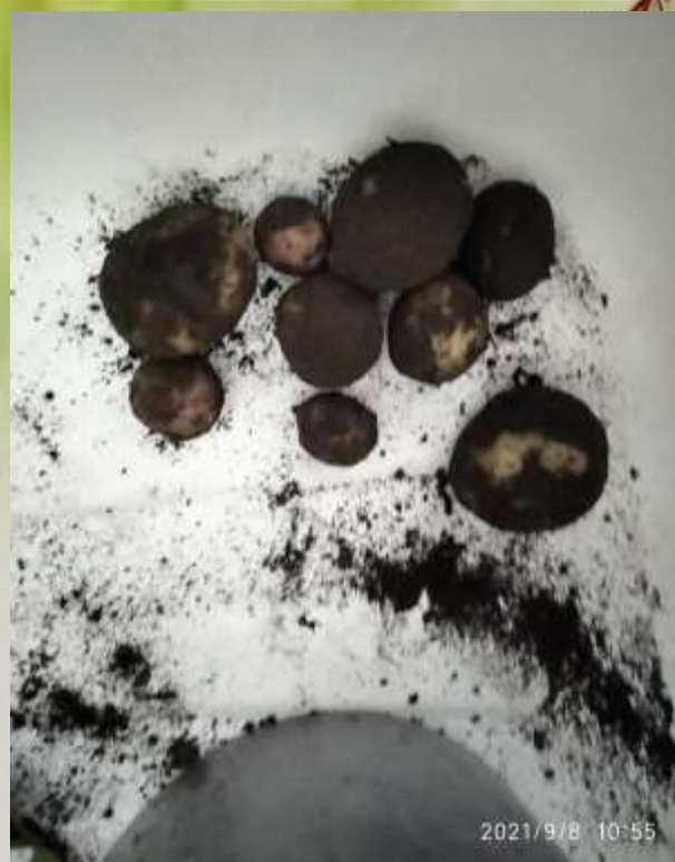
Вот такой картофель уродился