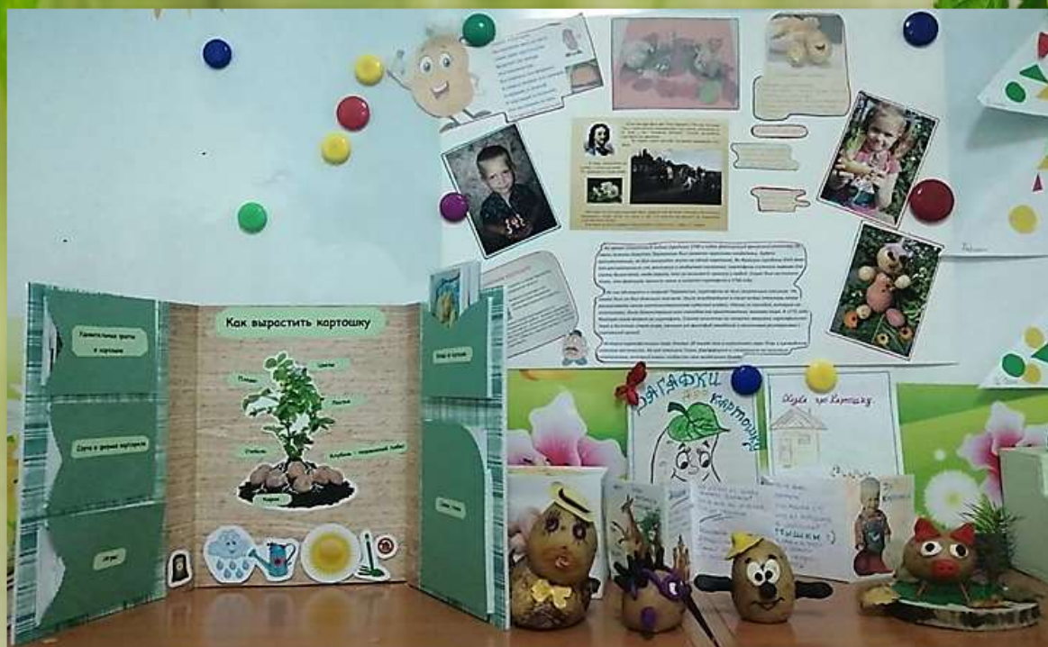
Собираем информацию о картофеле