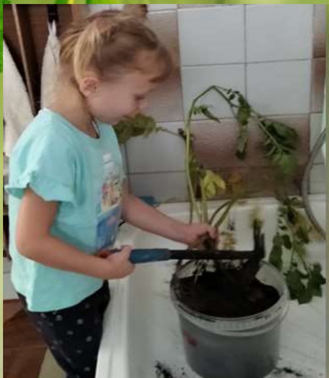
Посмотрим, уродился ли картофель?