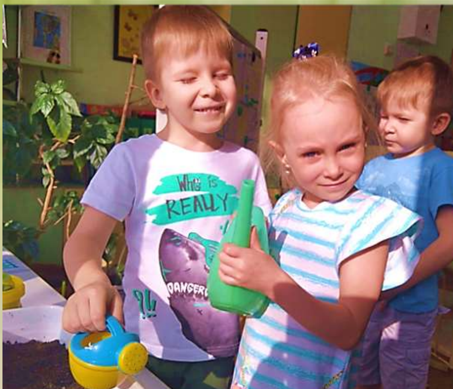
Эксперимент начался! Картофель посадили!