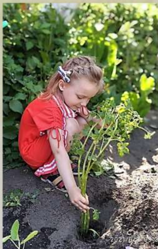
Дадли кусту ещё один шанс