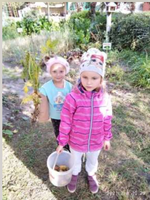
Покажем картофель нашим друзьям