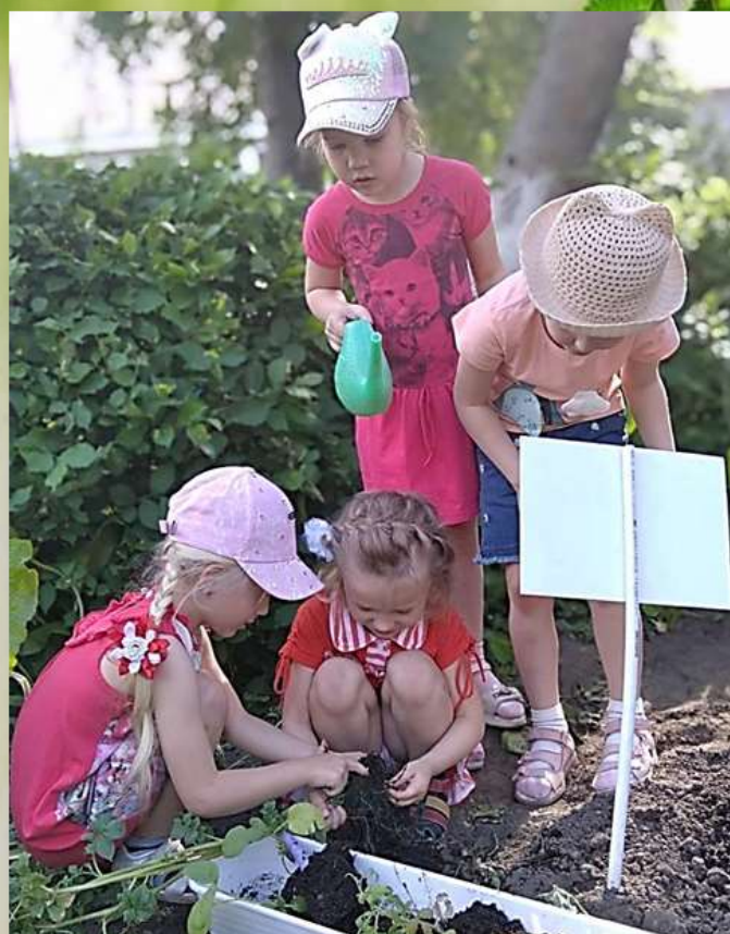
Куст есть, а картофеля нет???