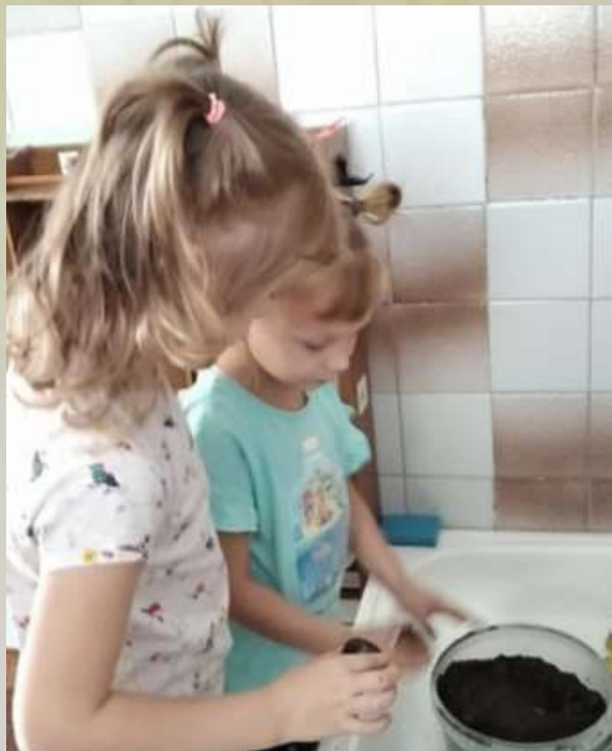
Раз картошка, два картошка