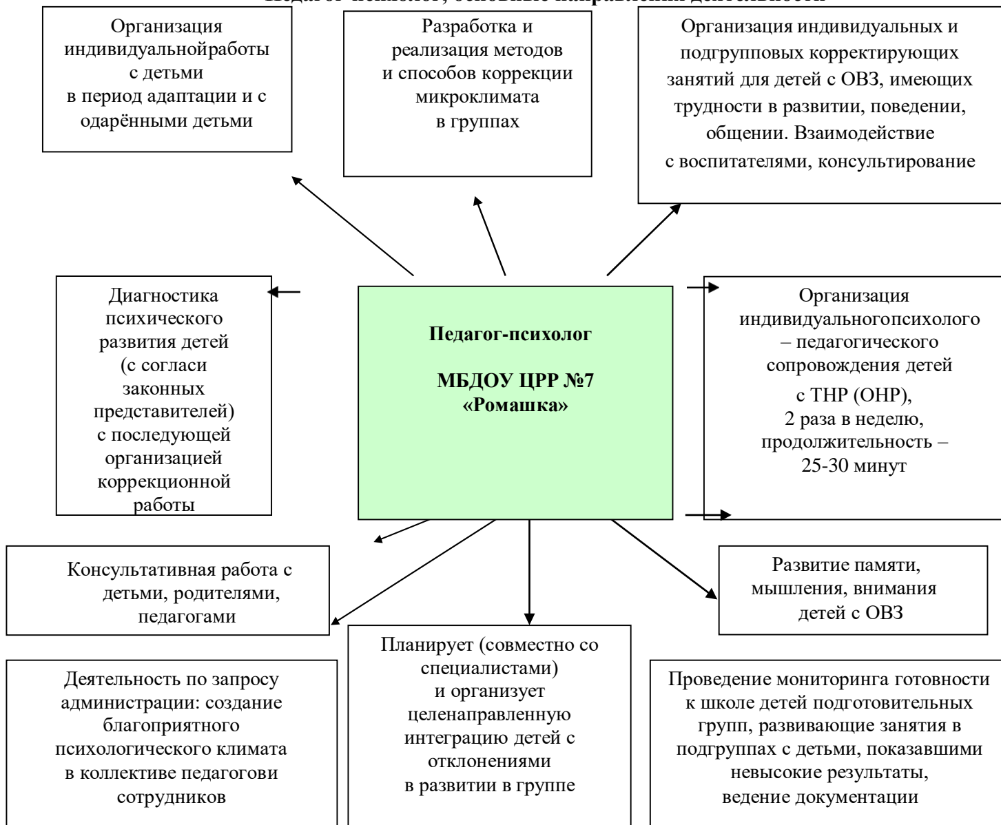
Рис. 2 «Педагог-психолог, основные направления деятельности»